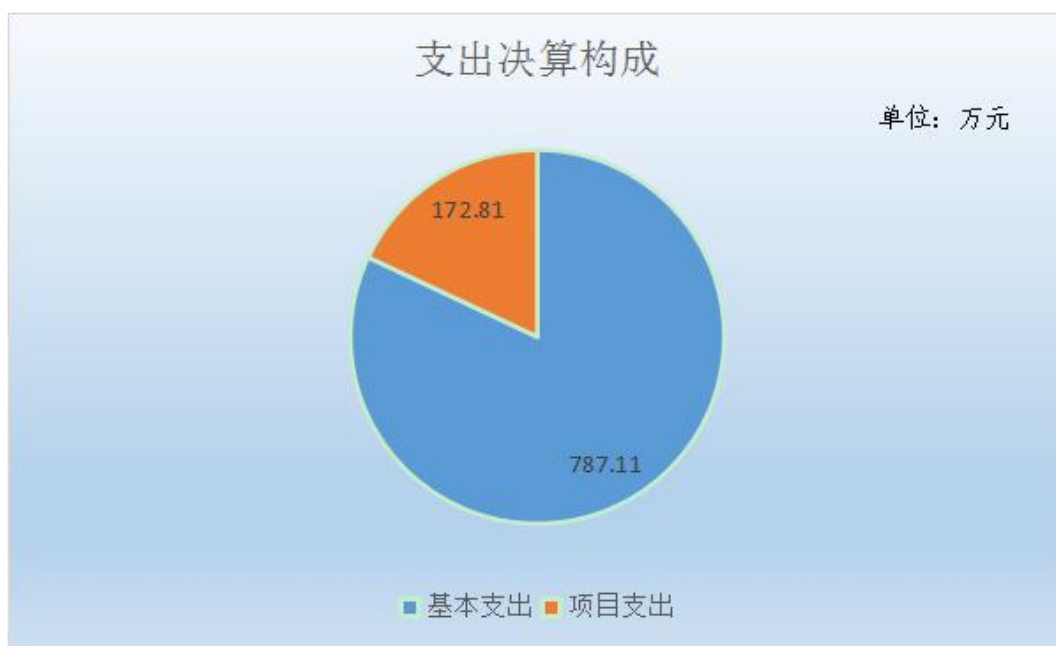
图 2：2021 年支出决算构成情况

本单位 2021 年度本年支出合计 959.92 万元，其中：基本支出 787.11 万元，占 82.00%；项目支出 172.81 万元，占 18.00%。 如图所示：