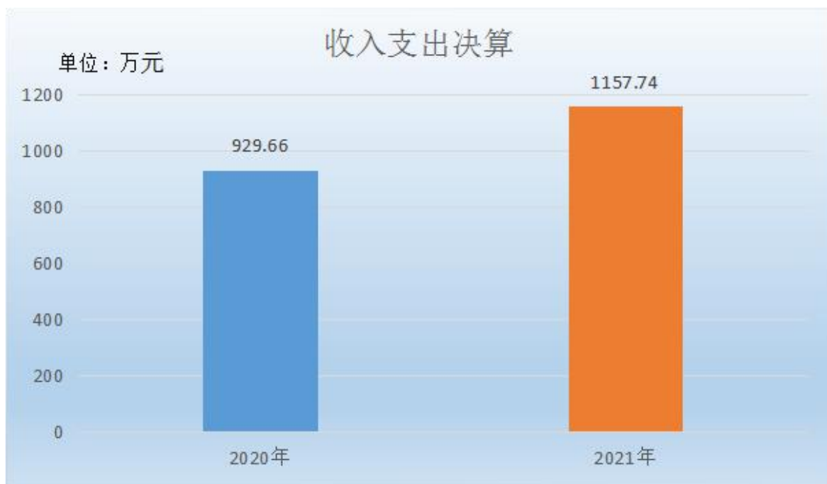
图 1: 2020-2021 年收支总计对比情况

本部门 2021 年度收、支总计(含结转和结余)1,157.74 万元。与 2020 年度决算相比,收支各增加 228.08 万元,增长 24.53%,主要原因是主要原因是人员增加及社会保险增长。