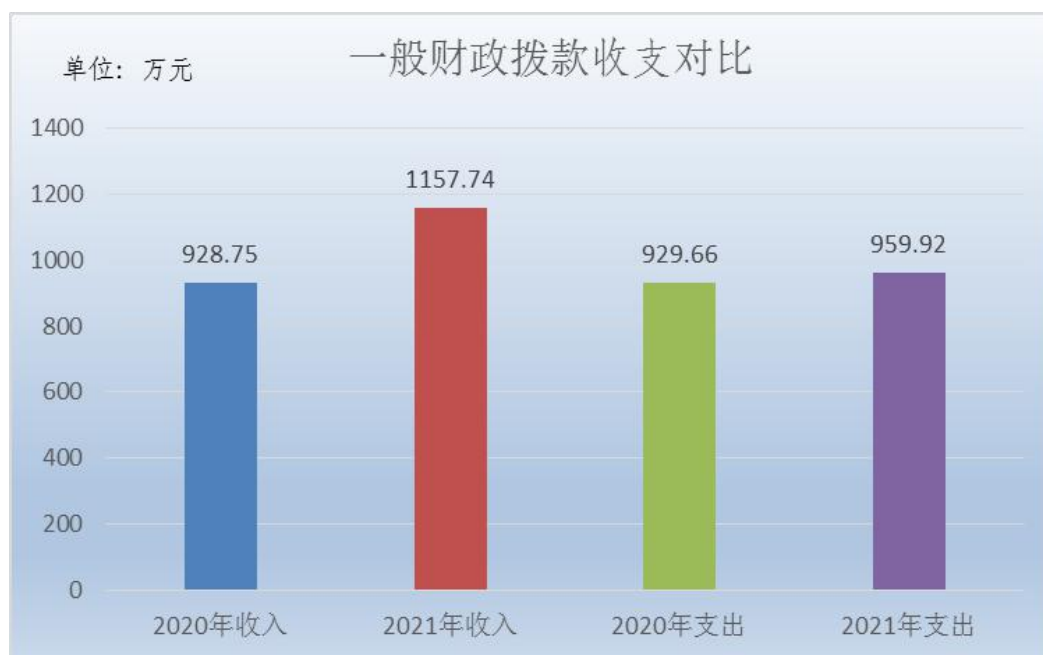
图 3: 2021-2021 年度财政拨款收支情况表 (单位: 万元)

228.98 万元，增长 24.65%，主要是是人员增加及社会保险增长；本年支出 959.92 万元，比 2020 年度增加 30.26 万元，增长 3.26%，主要是是人员增加及社会保险增长。